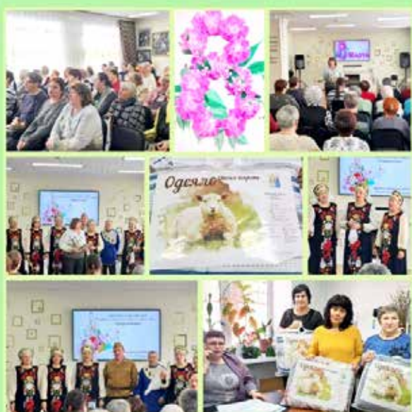
МОО САО г. Омска 000000 "ВОИ" Международный женский день 8 марта !

Мы привлекаем добровольцев при подготовке и проведении мероприятий. В качестве волонтеров нам нужны юристы, бухгалтеры, психологи, организаторы праздников, специалисты, которые умеют писать заявки на гранты, и другие. Их мы готовы принимать на практику. В нашей организации уже проходят практику учащиеся Омского промышленно-экономического колледжа, мы открыты к сотрудничеству и с другими образовательными организациями.