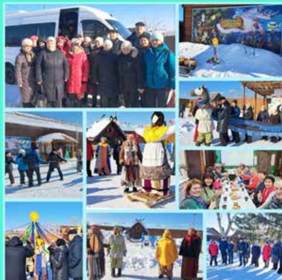
МОО САО г. Омска 000000 "ВОИ" в Этнопарке "Васин Хутор" на театрализованной программе "Масленица"