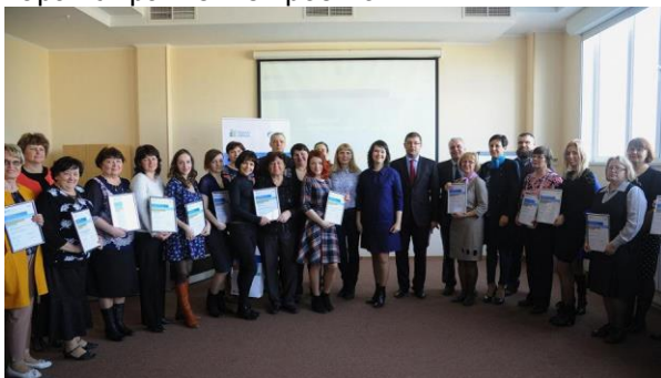
Победители конкурса «Родные города» в г. Омске

Помимо торжественных процедур участники Конкурса получили информацию о взаимодействии грантополучателей с грантодателем в процессе выполнения проектов в рамках семинара «Управление проектом».