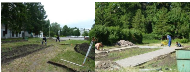
Планировка территории, укладка тротуарной плитки

Силами подрядной организации на средства университета были разобраны старые бордюры, выровнена территория, уложена тротуарная плитка.