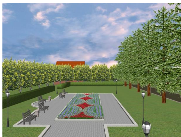
Первоначальный ландшафтный дизайн проекта

Целевая аудитория проекта – жители города Омска и области, студенты и сотрудники ОмГАУ в среднем около 15 тыс. человек.