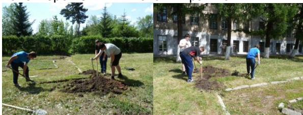
Подготовка траншеи для укладки электрического кабеля

Для установки фонарей требовалась укладка электрического кабеля. С этой целью силами волонтеров были выкопаны траншеи и ямы.