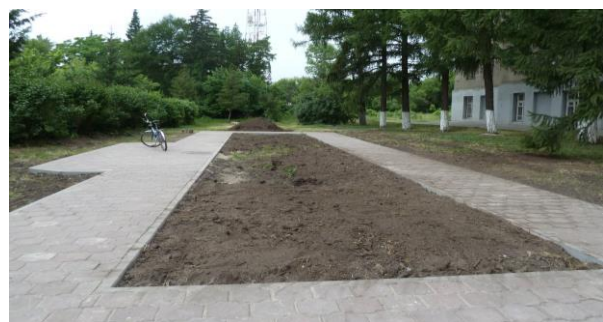
Так, после подготовительных работ стал выглядеть наш объект

На средства гранта была приобретена цветочная рассада.