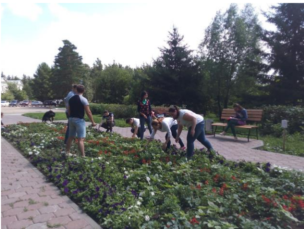
Сорняки растут бесконечно

Далее по проекту была предусмотрена установка