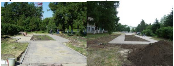
Выравнивание земли на клумбе

Следующий этап работы был связан с организацией цветочной клумбы. Для закладки клумбы была завезена и выровнена земля.