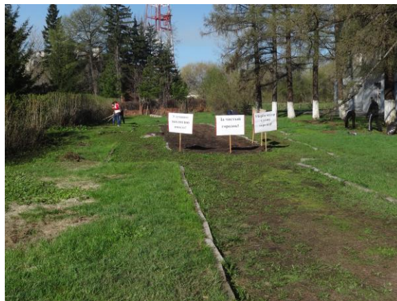
Так, первоначально выглядел наш объект

Реализация проекта началась в апреле 2016 года.