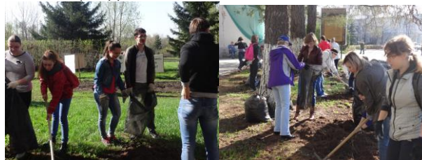
Экологический десант, апрель 2016 г.

Так как на первом этапе планировалась очистка посадок древесных культур от дикой поросли и мусора, то в рамках 3-го Всероссийского экологического субботника прошла череда экологических десантов на территории Омского ГАУ, организованных ОРОЗО «Земля – наш общий дом».