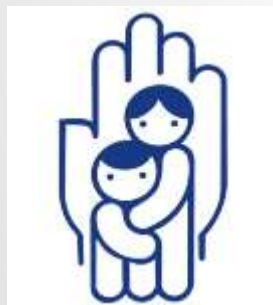
Российский детский фонд – Омское областное отделение