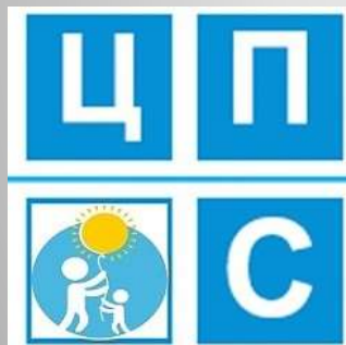
КУ ОО «Центр поддержки семьи»