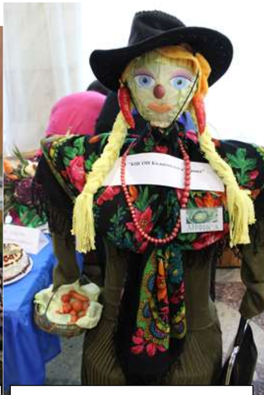
Конкурс пугало - какая красавица