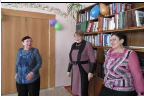
Для нас пели, а мы спляшем