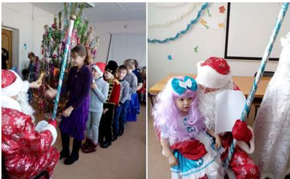
Образовалась очередь чтобы стихи рассказать. Первое стихотворение Мальвины