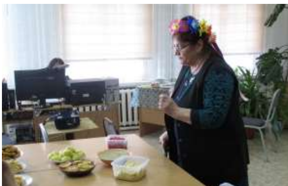
Украинская кухня с варениками