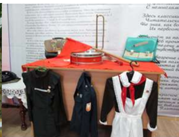
Пионеры и пионерская организация