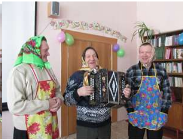
Весеннее настроение и полный зал женщин. Веселое и смешное поздравление от мужчин.