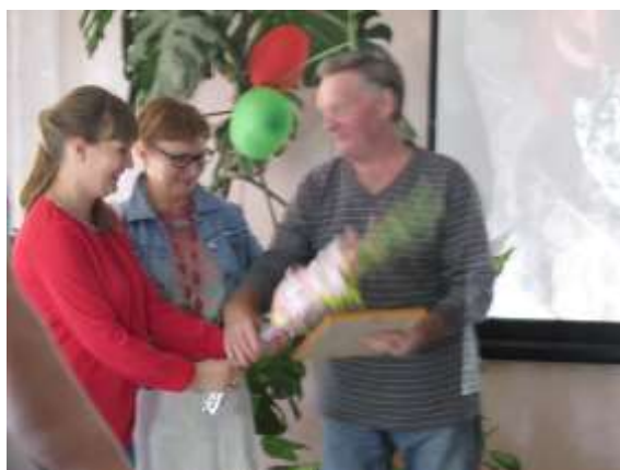
Не пропустили ни одного мероприятия