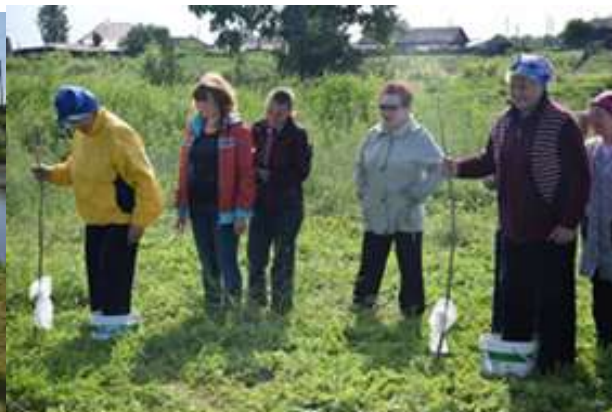
Провели конкурс «Бабка Ёжка» - главное ступу не потерять