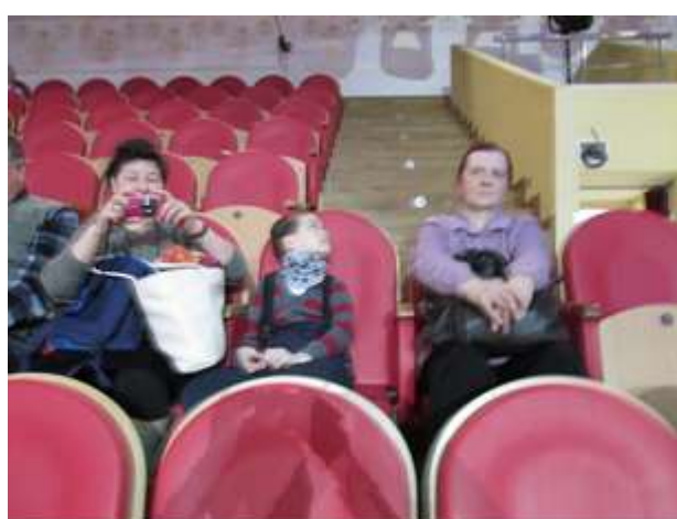
Самые первые заняли свои места

Мероприятие библионочь «Мой адрес Советский Союз». Для молодого поколения все в диковинку и форма и принятие в пионеры и магазин сельпо того времени