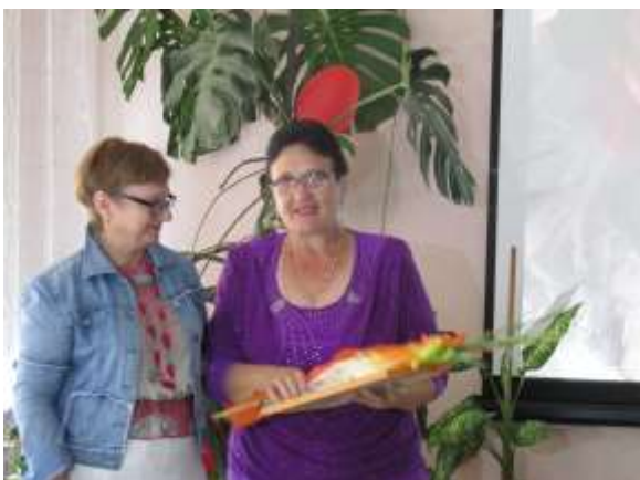
Награждение за добросердечность