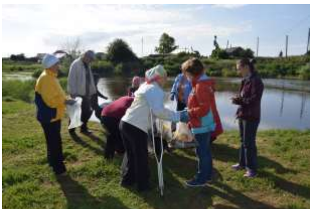
Очистили берег от мусора, в чистоте и отдыхать приятно

Такие мероприятия положительно влияют на эмоциональное состояние инвалидов, способствуют развитию их творческих способностей.