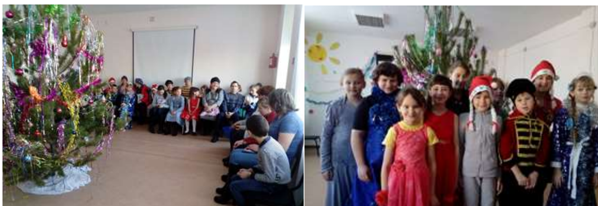
Елка красавица, детки молодцы, костюмы приготовили, сейчас начнутся чудеса.