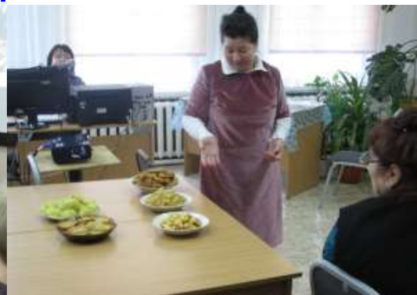
Блюда татарской кухни- рецепт приготовления