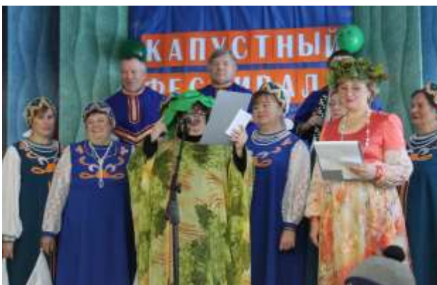
Начало, приветствуем весь честной народ