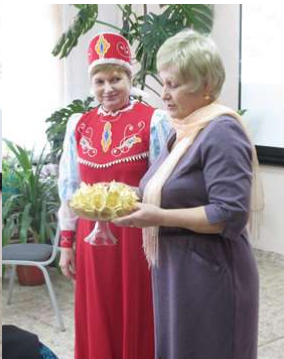
Русское гостеприимство блины с икрой и сладкие вафли еще как бабушка пекла

В ноябре месяце в Колосовке прошел уже третий капустный фестиваль в котором приняли участие сельские поселения