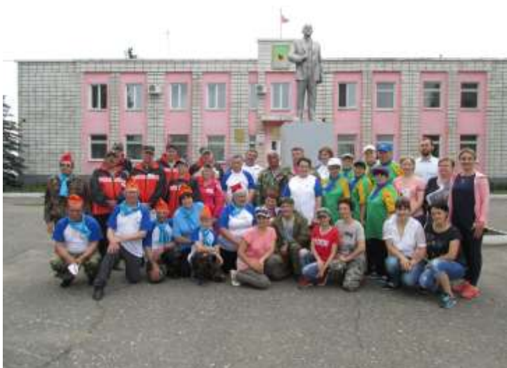
Несколько команд приняли участие в Турфесте

1-2 июля Колосовское ВОИ приняли участие в межрайонных паралимпийском туристическом фестивале «Здравствуй, Красное лето!» Седельниково – 2018».