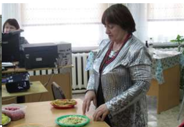
Украинская кухня горячие блюда