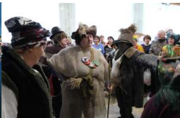
Конкурс пугало – живые пугала пустились в пляс.