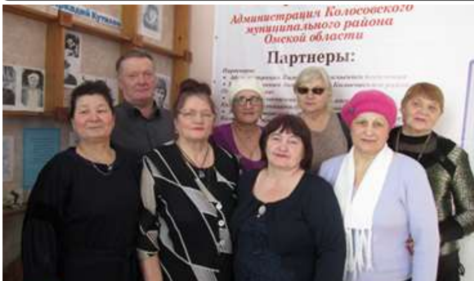
Президиум и ревизионная комиссия

Руководителем КМО ООО ООО ВОИ является председатель