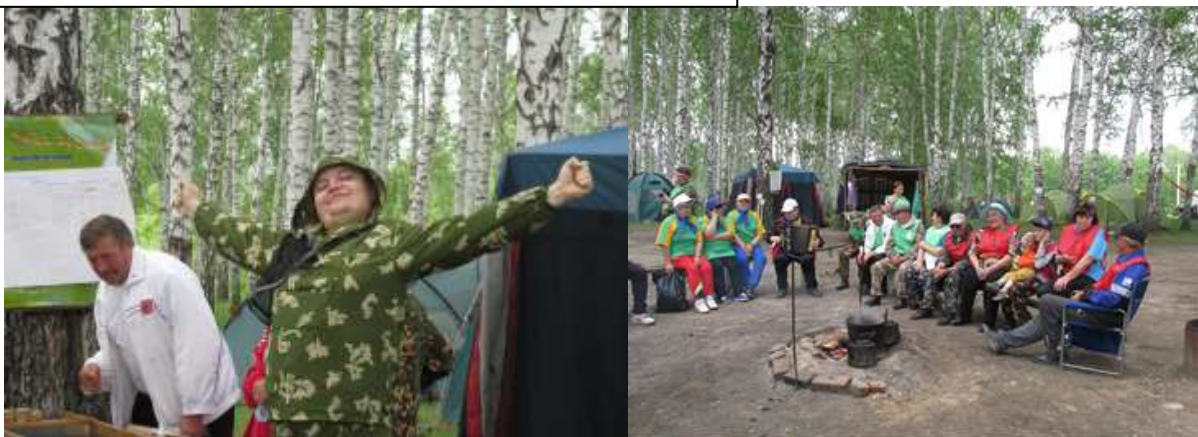
Доброе утро. Проживали участники в палаточном лагере, пели песни у костра.