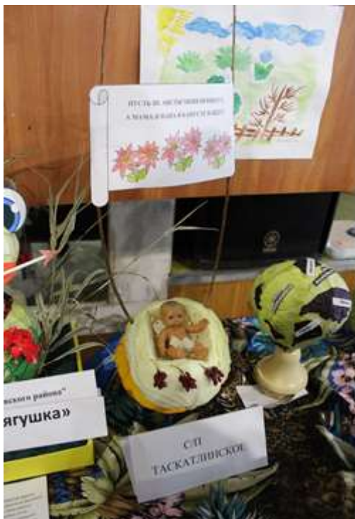
Поделки из капусты и детские рисунки

В ноябре месяце в Колосовке прошел уже третий капустный фестиваль в котором приняли участие сельские поселения