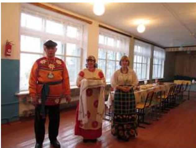
Последний населенный пункт, по старинке встречают хлебом и солью

1-2 июля Колосовское ВОИ приняли участие в межрайонных паралимпийском туристическом фестивале «Здравствуй, Красное лето!» Седельниково – 2018».