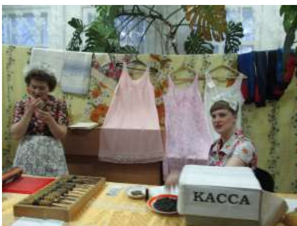
Сельпо- так было когда-то давно

Мероприятие библионочь «Мой адрес Советский Союз». Для молодого поколения все в диковинку и форма и принятие в пионеры и магазин сельпо того времени