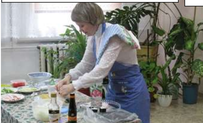
Мастер класс по приготовлению суши