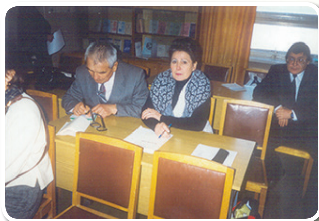
Семинар для национально-культурных объединений