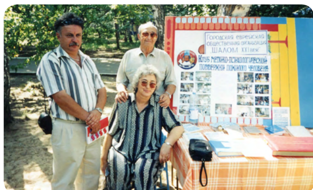
«ШАЛОМ. XXI век»

туру народов, проживающих в регионе. У омичей была возможность ближе познакомиться с национальным песенным и танцевальным творчеством, традиционной кухней, историей и этнографией народов Сибири, а также с интересными, увлеченными людьми, болеющими за сохранение культуры своих предков, благодаря которым в городе развиваются национально-культурные объединения. Праздник проводился уже в 4-й раз и вновь подтвердил, что совместные усилия национальной общественности, всех ветвей власти и населения в целом могут сохранить межнациональный мир и согласие.