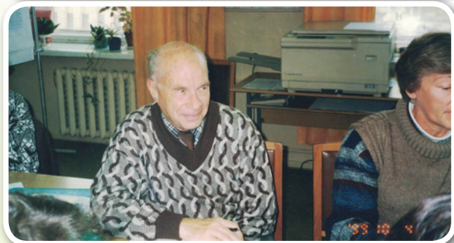
Информационная встреча для лидеров НКО