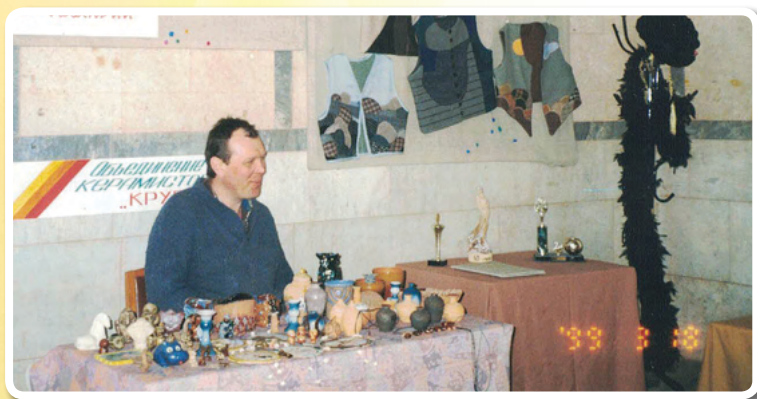
Ярмарка «Будем знакомы!» молодежных и детских объединений и творческих коллективов Октябрьского округа

человека; просветительская деятельность; охрана окружающей среды; развитие национальных культур; благоустройство среды обитания.