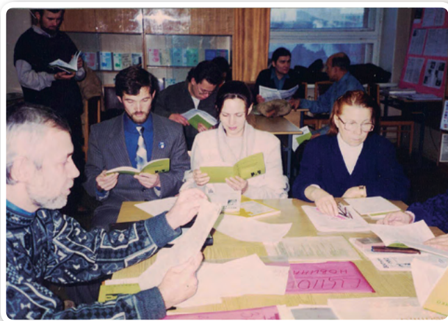
Семинар по фандрайзингу