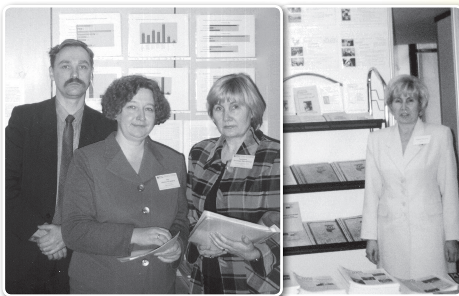
Омский опыт представлен на всероссийских конференциях в Москве и Санкт-Петербурге

третьего сектора. Это были те, чей опыт и нарабатываемые практики важно было распространить. И то, что омичи представляли несколько НКО, говорит о значимых наработках в этой сфере. Им была предоставлена возможность оформить свои презентационные стенды, там представили и печатную продукцию о деятельности омских НКО, которую полностью разобрали участники конференции из других регионов.