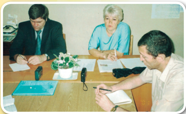
Встреча в РЦ с сотрудником Аппарата Уполномоченного по правам человека РФ