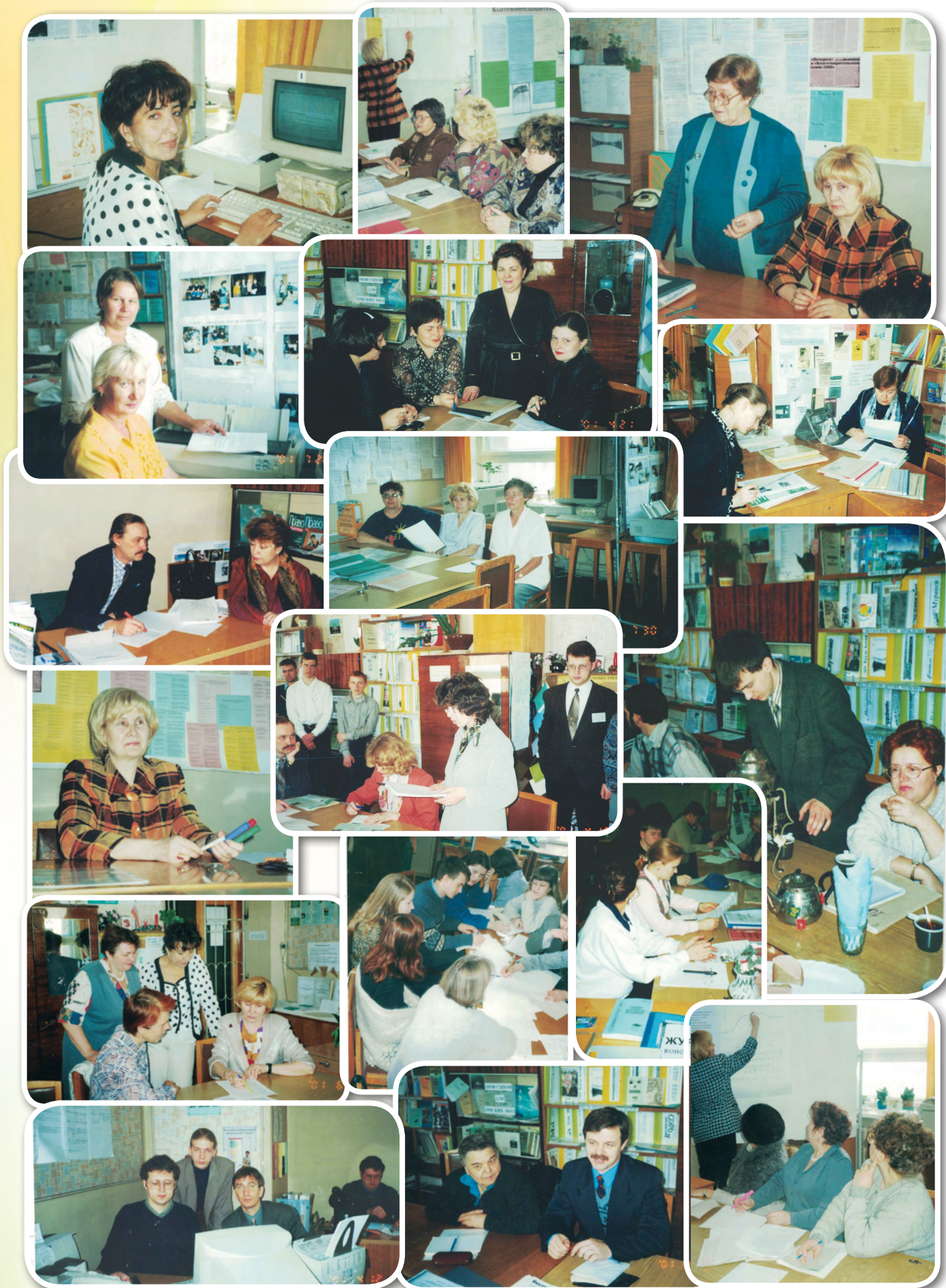
Работа Ресурсного центра