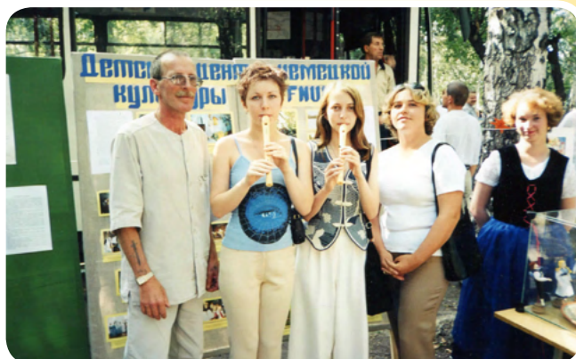
Немецкий детский центр «Хоффнунг»