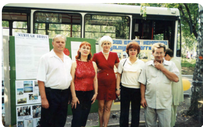
Союз немцев Сибири