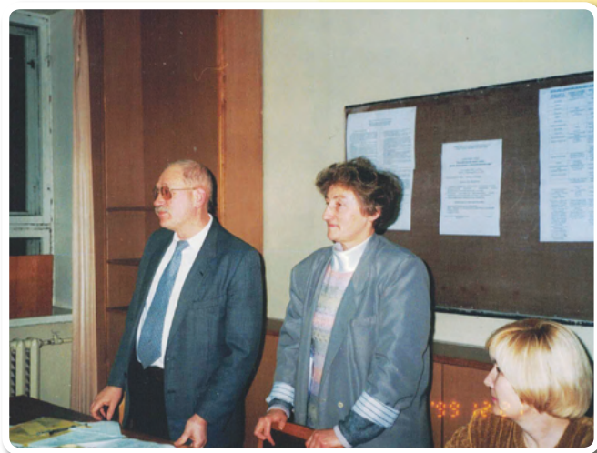
Ведущие семинаров, тренеры РЦ

В феврале омичи прошли обучение в Санкт-Петербурге на выездном семинаре « Телекоммуникации. Интернет », чтобы на основе полученных знаний и навыков создать интернет-страницу, посвященную общественным организациям Омской области.