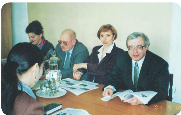
Конкурсная комиссия 2-го областного конкурса грантов

Совместную акцию «Твори добро» провели добровольцы отряда «Поиск» из училища № 46, активисты КТОСа, члены Детско-юношеского экологического центра, общества «Милосердие», Совета ветеранов САО, организаций «ПаРи» и «Амальтея». Они организовали концерт-встречу с воспитанниками детских домов № 1 и 4 и школы-интерната № 2. Всем детям вручили подарки.