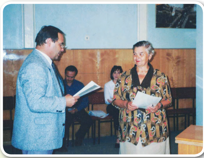
Победитель конкурса «Добрый город». Социально значимый проект отделения Союза женщин России Ленинского округа

· По направлению «Благоустройство среды обитания» победил проект общественной организации «ЭКО» «Возрождение дендропарка».