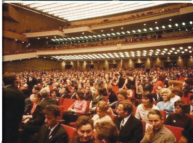
Всероссийский Гражданский Форум