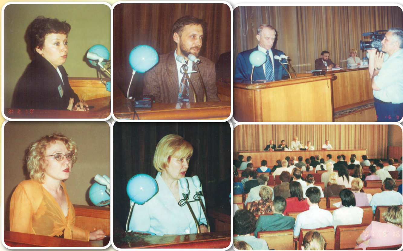
Конференция «Социальное партнерство-2001. Омский опыт»

шение взаимопонимания и взаимодействия власти, бизнеса и некоммерческих общественных организаций в сфере решения социальных проблем жителей Омского Прииртышья.