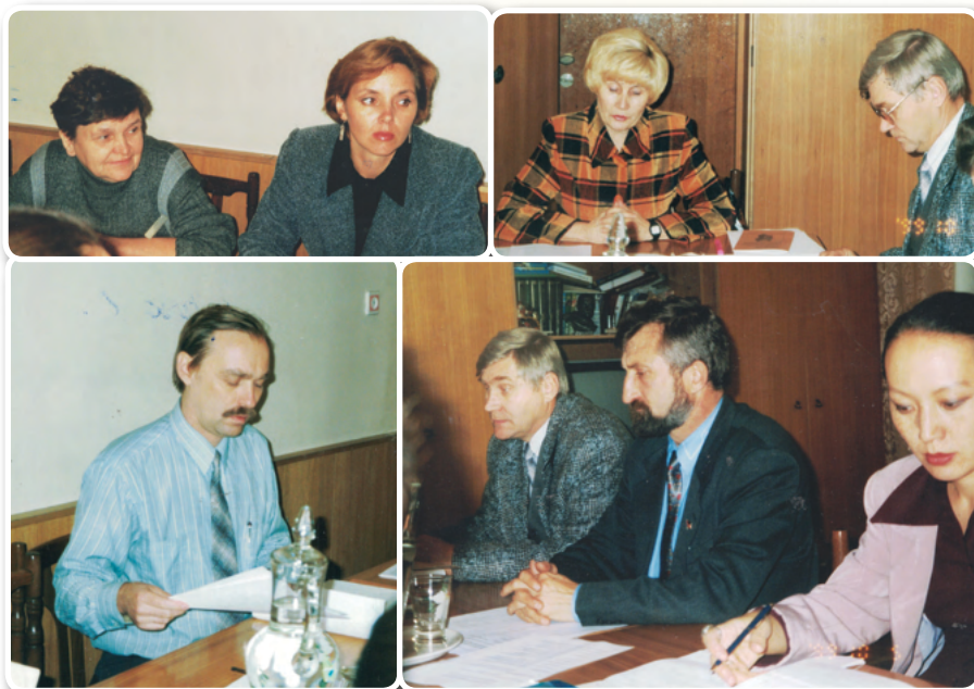
Конкурсная комиссия областного гранта

объединениями Омской области в 1999 году». Омская область стала одной из первых в стране, где на областном уровне был организован конкурс грантов, предоставляемых общественным объединениям администрацией области. На конкурс была подана 51 заявка от 37 НКО. Победителями стали 18 проектов по 9 направлениям: работа с ветеранами и инвалидами; работа с подростками и молодежью; социальная поддержка больных; защита детства, материнства и семьи; формирование правовой культуры и защита гражданских прав