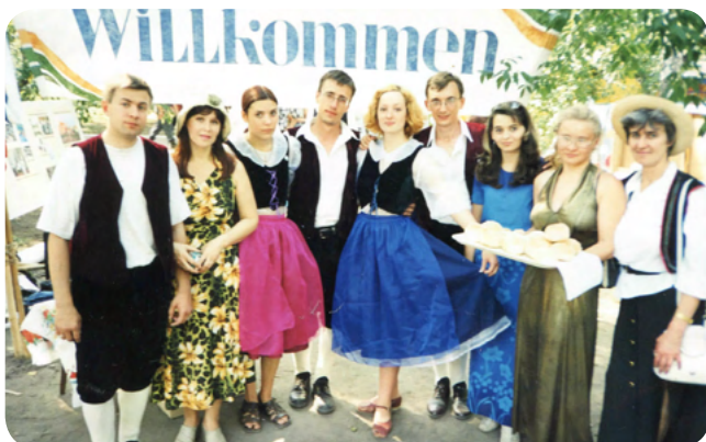
Немецкое общество «Согласие»