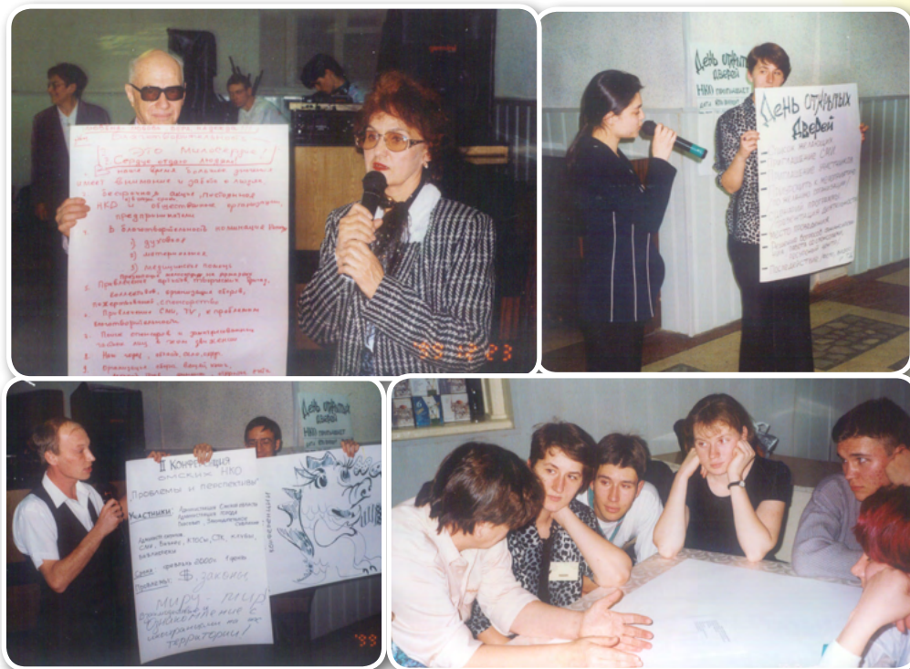
Расширенный предновогодний Совет НКО

дов побывали на елке во Дворце творчества. Союз предпринимателей оплатил выездной спектакль театра «Галерка» в Тару; там дети из трех сельских детских домов впервые увидели театр: актеров, музыкантов, костюмы, декорации, да еще и подарки получили. Спонсоры подготовили 11 тысяч новогодних подарков для детей-сирот, в больницах, детских домах, домах ребенка. 23 тысячи подарков получили дети в семьях инвалидов.