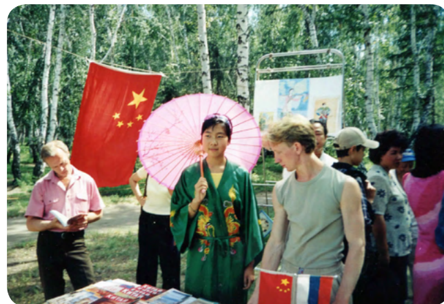
Центр китайской культуры «Золотой дракон»