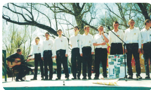
Фестиваль добровольческих объединений «Добрые дела – каждый день»

30 апреля на Зеленом острове состоялся первый областной Фестиваль добровольческих объединений «Добрые дела – каждый день» . Этот фестиваль был новинкой для Омска, поэтому вызвал большой