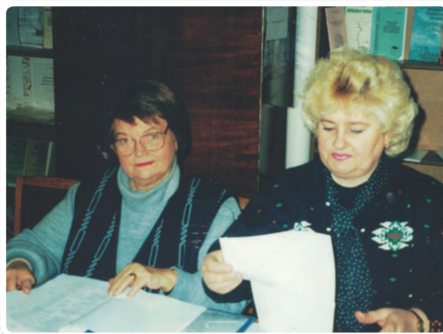
Консультации в Ресурсном центре