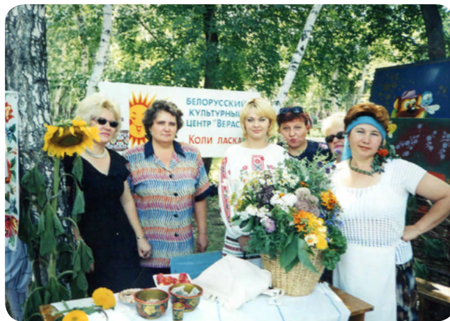
Центр белорусской культуры «Верасы»