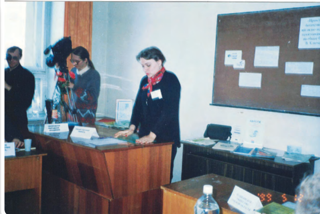
Круглый стол «Благотворительная деятельность в Омской области: состояние и перспективы»