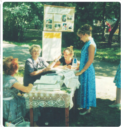
2-я Ярмарка «Добрый город»