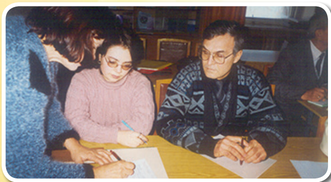
Семинар для национально-культурных объединений