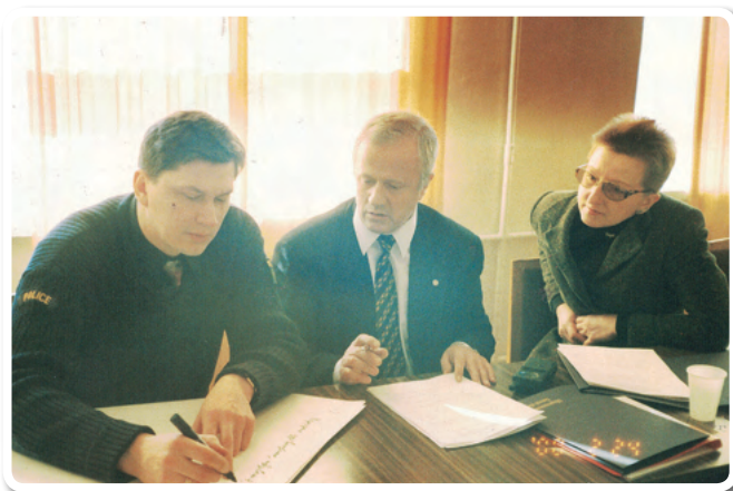
Круглый стол «Общественность и бизнес – деятельность для местного сообщества»

В марте прошел круглый стол «Общественность и бизнес: деятельность для местного сообщества». По инициативе Общественной палаты проблемы совместной деятельности обсуждали лидеры омских НКО, представители бизнес-структур и средств массовой информации. Некоммерческие организации в своей основной деятельности и бизнес в своей благотворительной деятельности работают на общем поле, с одними и теми же социальными группами населения. В стремлении максимально помочь этим социальным группам