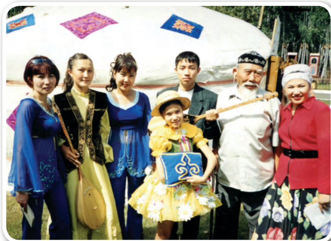
Казахский ансамбль «АМАНАТ»