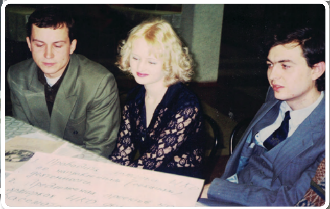
Расширенный предновогодний Совет НКО