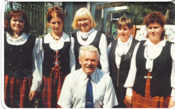
Финская Сибирская ассоциация