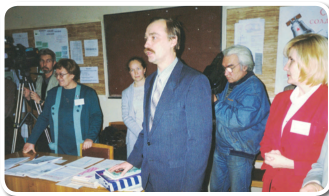
Презентация работы Ресурсного центра