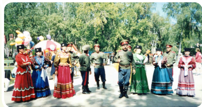
Сибирское Казачье войско. Омский отдел