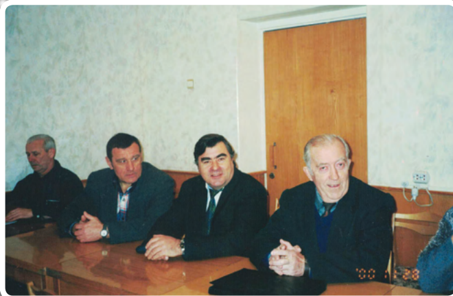
Круглый стол «Новые перспективы общественных организаций»