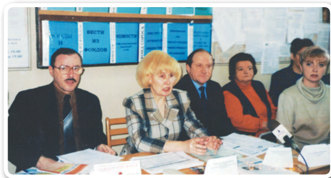
Пресс-конференция НКО участников Гражданского Форума в Москве

По мнению организаторов и участников конференции главным ее итогом стали активизация общественных инициатив граждан области, улуч-