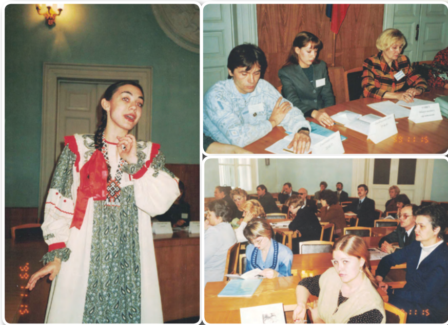
Презентация Благотворительного сезона в Законодательном Собрании

который проходил с 15 ноября 1999 года по 15 января 2000 года. Он был направлен на создание благоприятной среды для активизации добровольческих и спонсорских инициатив омичей, развивающих социальную сферу города. В ходе реализации проекта оказана помощь нуждающимся детям, инвалидам, ветеранам войны и труда. Пункты сбора благотворительной помощи были организованы в округах.