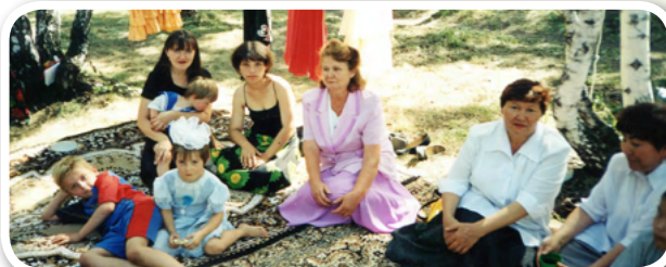
Курултай башкир Омской области