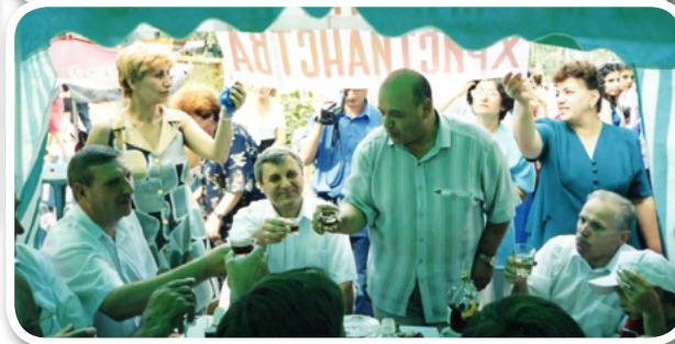
Армянский культурный центр «ЛУИС»