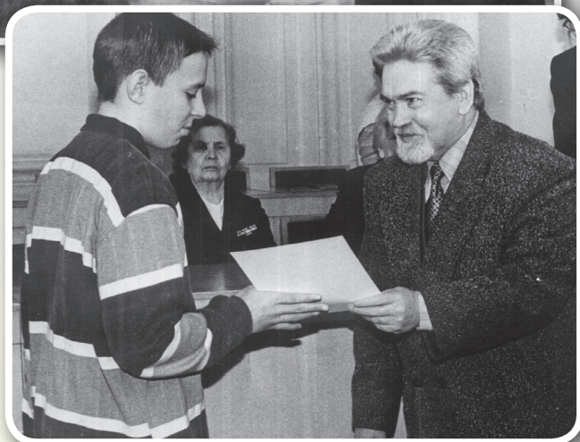
Торжественное подведение итогов Благотворительного сезона