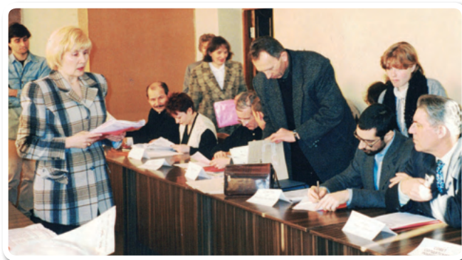
Круглый стол «Состояние и пути реализации защиты прав человека в Омской области»