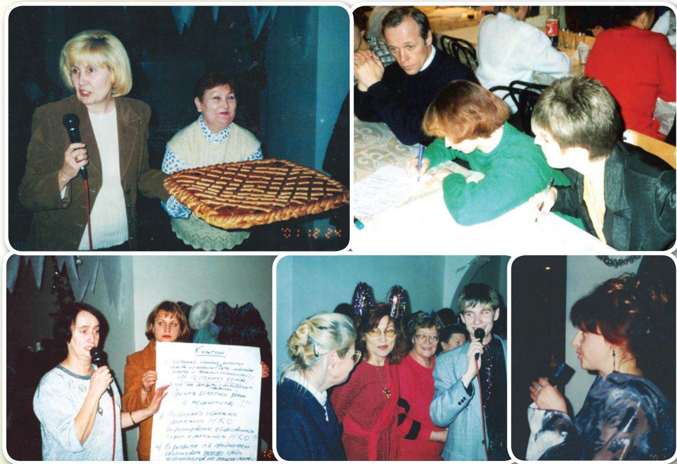
Расширенный предновогодний Совет НКО

Итоги акции «Добрый город» подвели на расширенном августовском заседании Совета НКО с приглашением лидеров общественных организаций,