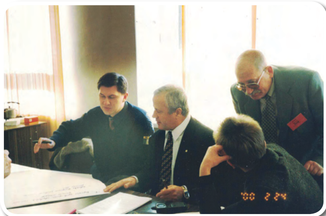
Круглый стол «Общественность и бизнес – деятельность для местного сообщества»