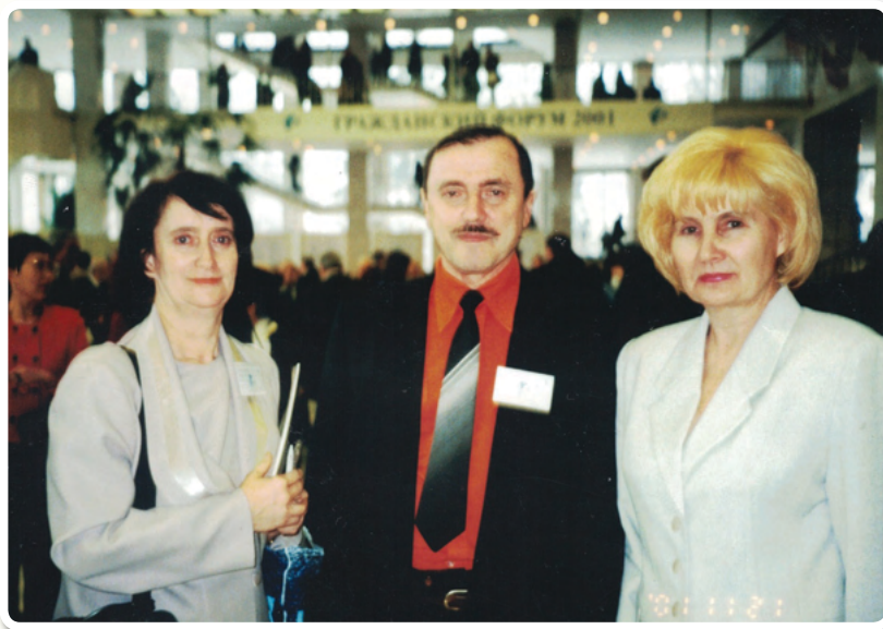
Всероссийский Гражданский Форум

«Сотрудничество государства с гражданским обществом может быть очень продуктивным».