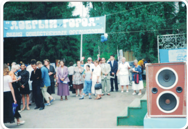
Уличная Ярмарка НКО «Добры́й город»