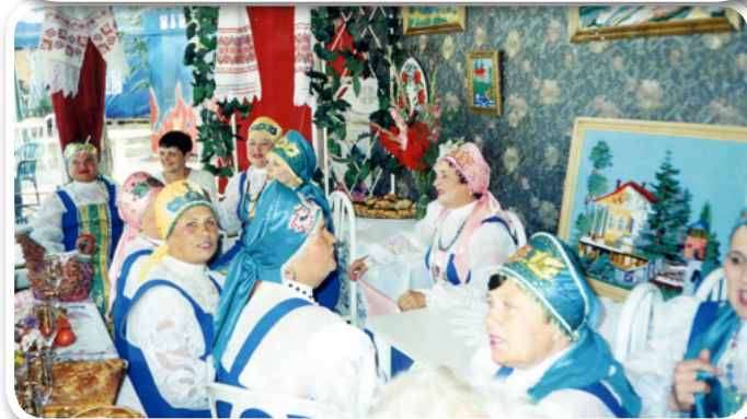
Центр русской культуры