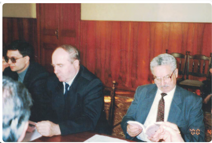
Круглый стол, посвященный законопроекту «О социальном заказе Омской области»