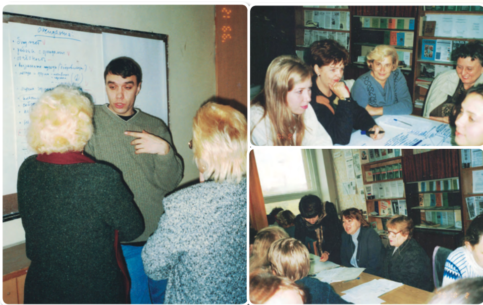
Семинар «Стратегическое планирование для НКО»

Семинар для руководителей КТОСов и СТК Советского административного округа показал, что лидерам этих общественных организаций необходимо сотрудничество. Участники, дополняя и корректируя друг друга, искали пути решения общих проблем. Все получили пакет информационных и методических материалов по теме семинара.