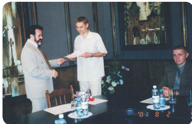
Вручение грантовых сертификатов победителям 2-го областного конкурса грантов

Радиопрограмма «Омское время» также рассказала о добровольческих акциях этого дня и поздравила омских добровольцев с праздником.