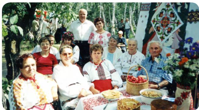
Украинский центр им. Тараса Шевченко