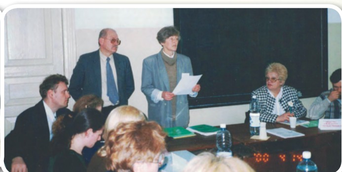
Круглый стол по добровольческому движению