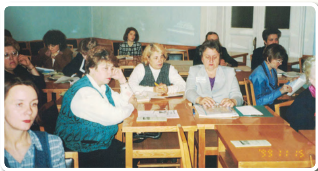
Презентация Благотворительного сезона в Законодательном Собрании

В начале года были подведены итоги Благотворительного сезона-98 (см. Приложение 1). А в ноябре был объявлен 2-й Благотворительный сезон,