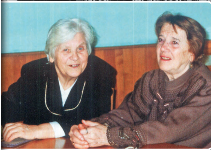
Торжественное подведение итогов Благотворительного сезона в Законодательном Собрании