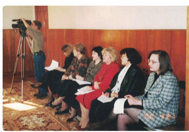
Конференция «Роль женских НКО в решении социальных проблем общества»