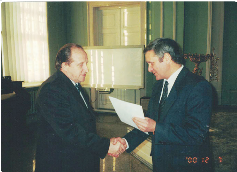
Вручение благодарственных писем лучшим добровольцам