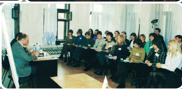
Обучение омских журналистов основам права