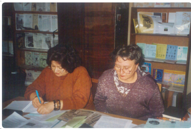
Участники семинара в Ресурсном центре