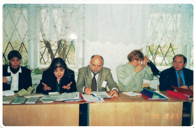
Круглый стол «Роль некоммерческих организаций в развитии городского сообщества»

В конце ноября состоялся круглый стол «Роль некоммерческих организаций в развитии городского сообщества» . Эта важная тема обсуждалась в рамках общегородской конференции «Стратегический план: концепция развития города». 53 участника круглого стола – лидеры общественных объединений – обсуждали перспективы развития города вместе с представителями законодательной и исполнительной власти города и области. Участники встречи обсудили ряд принципиальных вопросов.