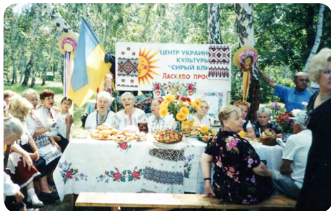
Центр украинской культуры «Сірий клин»