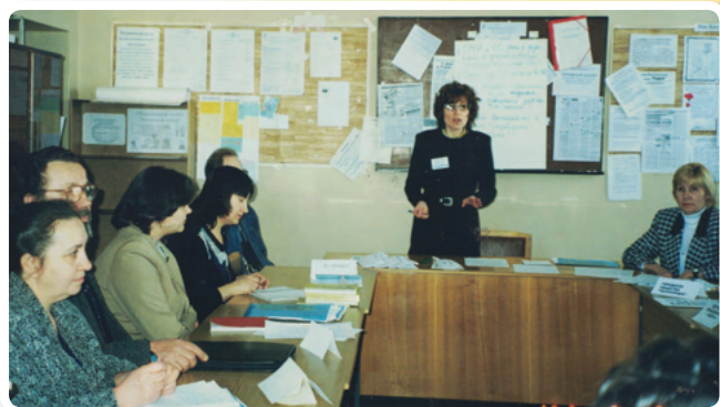
Круглый стол «Омские СМИ и третий сектор»

ничным, но и дискуссионным, деловым, оживленным. Был проведен социологический опрос участниц встречи на тему «Мужчина и женщина в современной России», а также прошел мощный «мозговой штурм», целью которого стал выбор наиболее интересных и перспективных проектов для решения самых актуальных проблем как женского движения, так и в целом жизни женщин Омска и области. В результате встречи были выработаны: