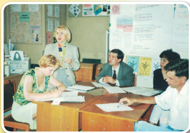
В Ресурсном центре защита проектов

программе «Эффективная НКО», по ней обучались лидеры и активисты 42 омских НКО. Они изучали самые разные аспекты работы некоммерческих организаций – от планирования и управления НКО, работы со спонсорами до социального маркетинга и PR. Тема завершающего цикла семинаров занятия – «Работа со СМИ». Участники разбирались, как инициировать контакты со СМИ, организовывать спецмероприятия для прессы, почему в организации должен быть ответственный за взаимодействие со СМИ и т.п.