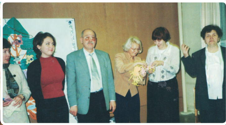
Расширенный предновогодний Совет НКО