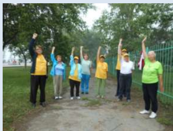
В День физкультурника на городском празднике