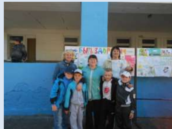
СОШ № 148