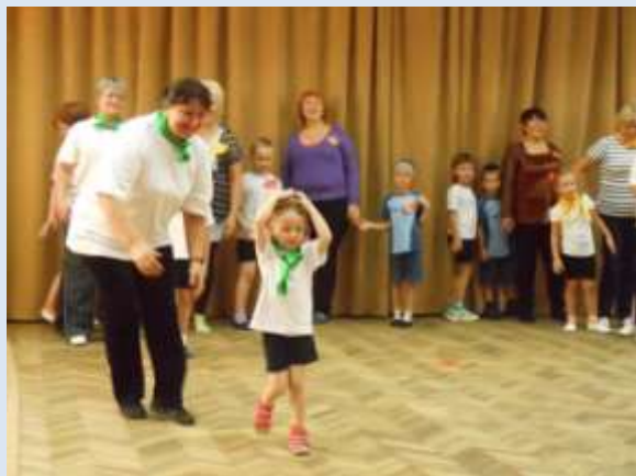
ДОУ № 23