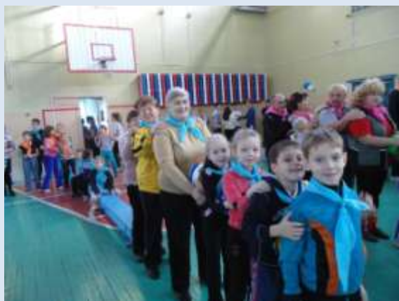
СОШ № 61