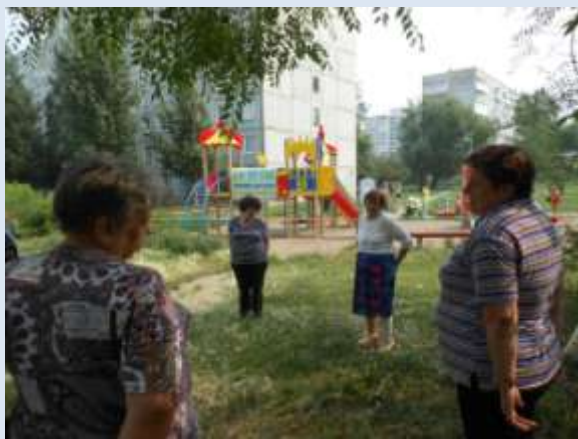
В КТОСе «Левобережный-5»