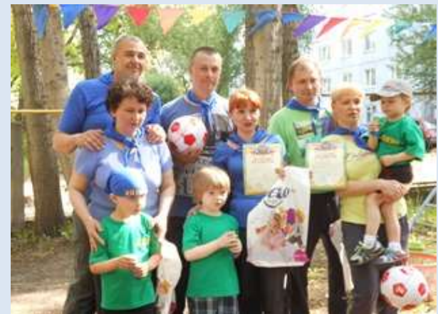
ДООУ № 365