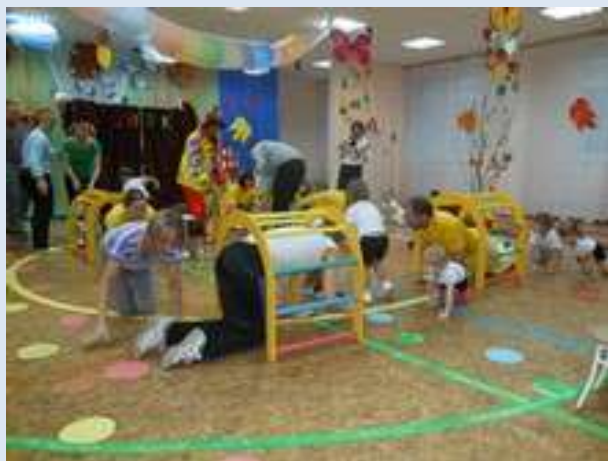
ДОУ № 122

В рамках проекта «Растем и развиваемся вместе» проведены 13 праздников, положивших начало созданию Семейных клубов. Клубы помогут объединить деятельность родителей и педагогов в деле воспитания малышей и организовать обмен опытом их развития и оздоровления.