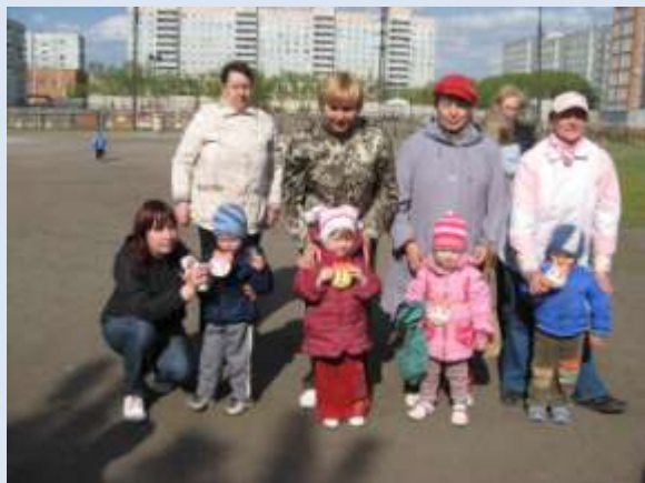
ДООУ № 23