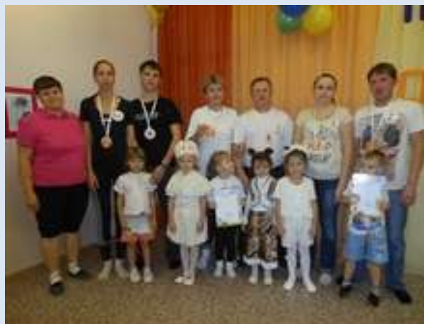
ДОУ № 134