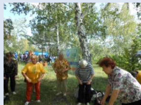
На открытии спортплощадки в парке Советского округа