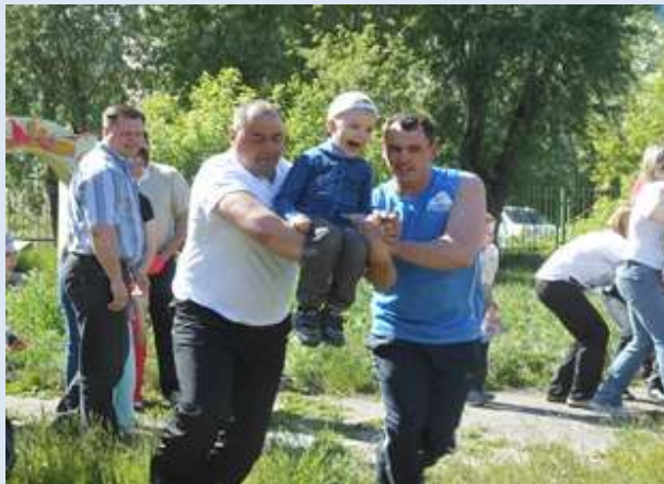
ДООУ № 258