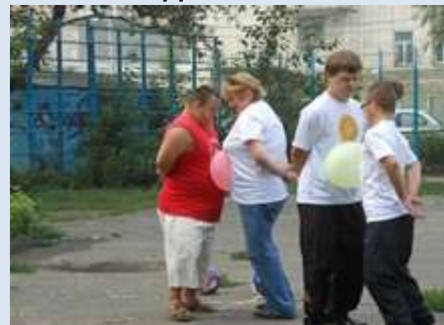
ОРООИ «Даун Синдром Омск»