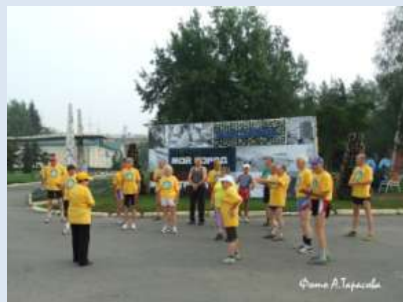
С Клубом ветеранов бега «Оптимист»