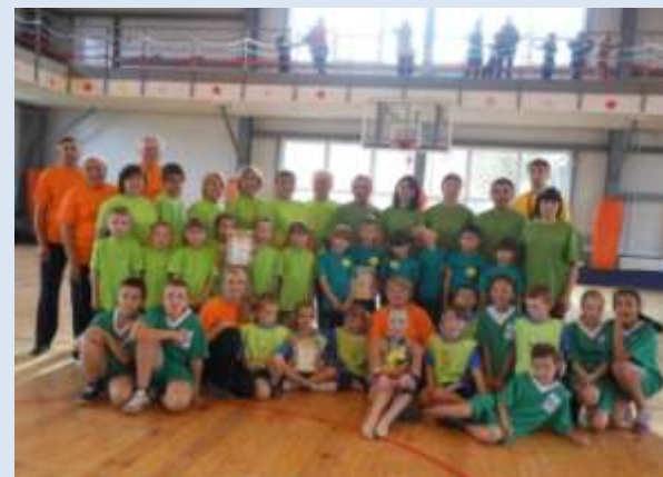
СОШ № 68