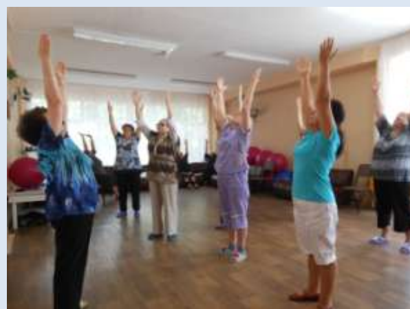
В КЦСОН «Сударушка»