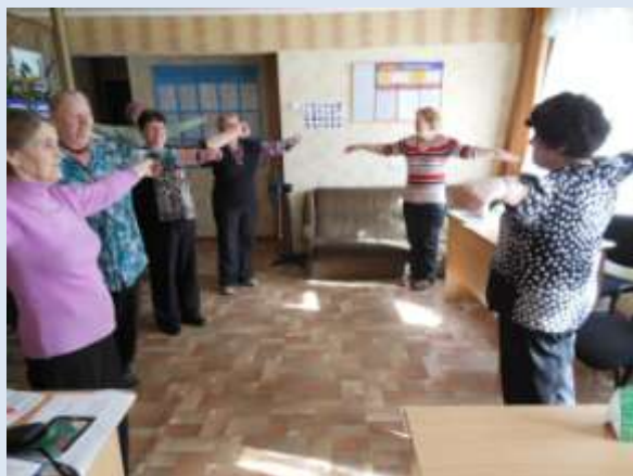
В КТОСе «Заозерный-2»

В июне-сентябре 2013 года ОГОО «Дар» и БУ города Омска «Спортивный город» совместно провели 13 мастер-классов по оздоровительной гимнастике, в которых участвовали в целом 360 чел