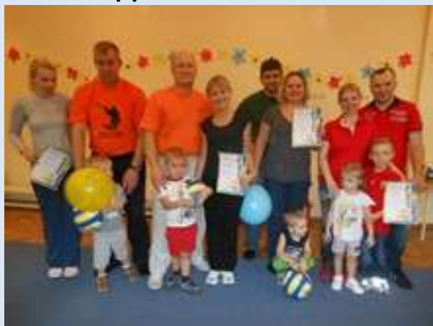
ДОУ № 293