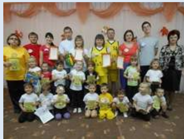
ДОУ № 258